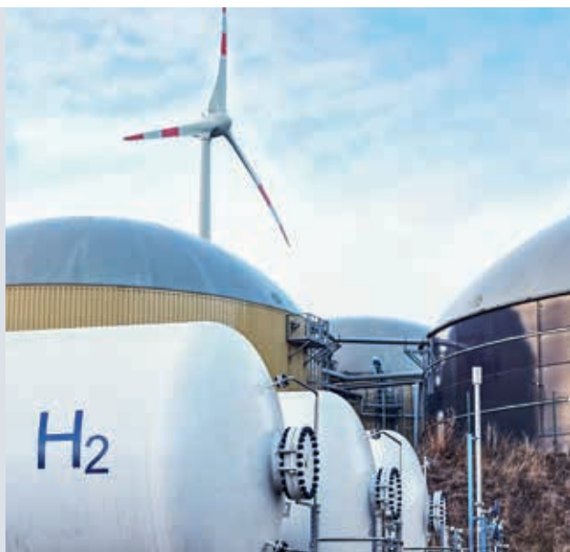
Außenansicht eines Hybridkraftwerks, Foto: BDEW / Swen Gottschall